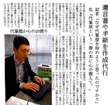
講師は新聞各紙へ掲載、テレビ各局出演実績ある代筆屋行政書士。